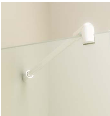
Fijo con tirante incorporado.