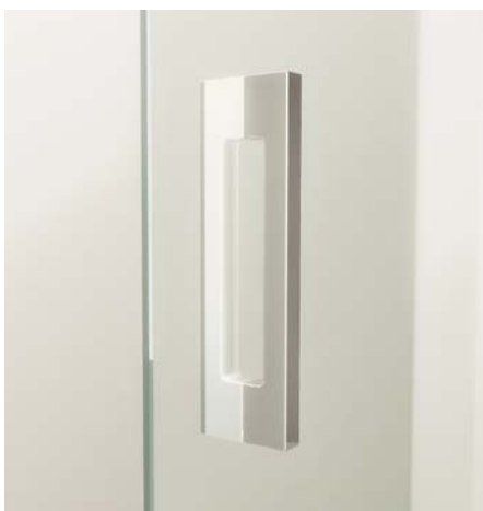
Detalle del tirador.