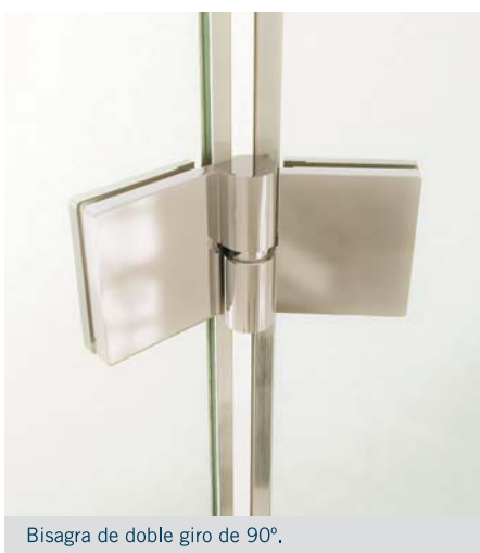
Bisagra de doble giro de 90°.